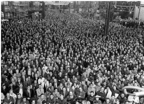
Huelga general obrera