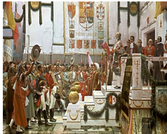
Constitución de 1812