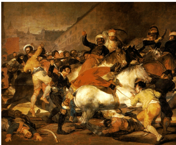
El 2 de mayo de 1808 (Goya)

Esta etapa fue narrada, de un modo excepcional, por el pincel maestro de Goya , auténtico referente en la historia del arte y anticipador de multitud de movimientos modernos.