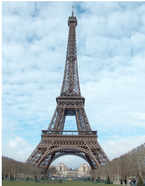
La Torre Eiffel (París)