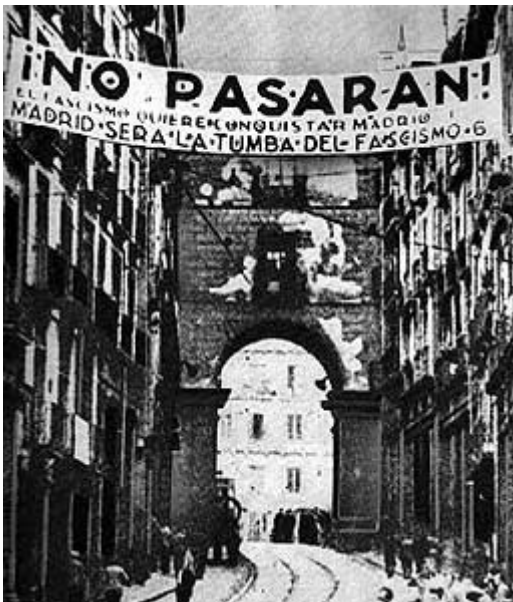
Guerra civil española