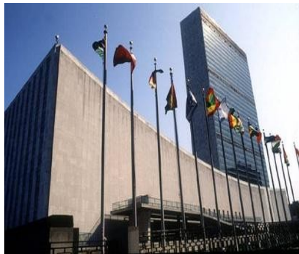
Sede de la ONU en Nueva York