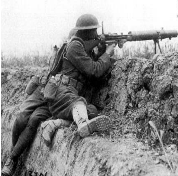
Primera guerra mundial