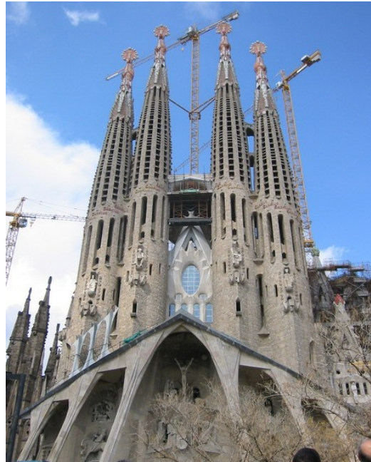
La Sagrada Familia (Gaudí)