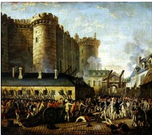
Toma de la Bastilla (14 de julio de 1789)

En vísperas del año 1789 se conjugaron factores económicos, ideológicos-políticos y sociales, que desencadenaron la reacción de la burguesía y la sublevación popular. El 14 de julio de 1789 , el pueblo de París tomó la vieja fortaleza de la Bastilla, la cárcel, símbolo de la arbitrariedad del Antiguo Régimen. La revolución estaba en marcha. A partir de ahí, se suceden varias etapas como la república, la etapa del terror (Robespierre), golpe de Estado que llevó al poder a un joven general, Napoleón Bonaparte , con el que se inicia una nueva etapa: la era napoleónica, con la propagación de las nuevas ideas por toda Europa, las victorias militares y derrotas que le llevan al exilio y supone el final de la revolución.