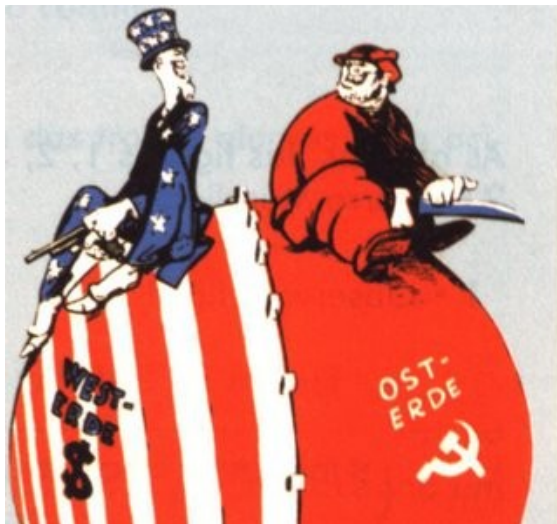
Caricatura sobre la Guerra Fría

La ONU se formó tras la segunda guerra mundial para evitar nuevas guerras y encauzar los posibles conflictos entre países, aunque desde el principio tuvo poco poder de presión.