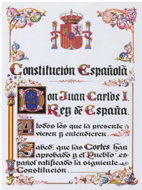
La Constitución de 1978