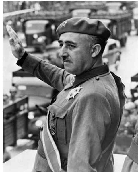
Dictadura de Franco