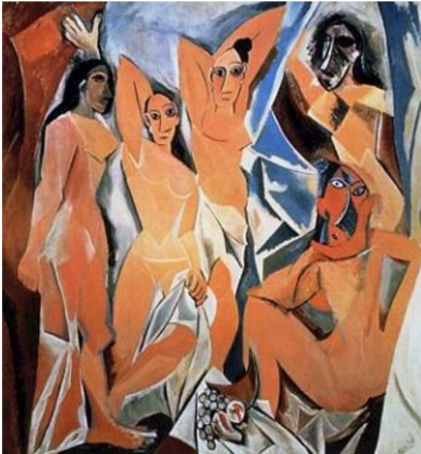
Las señoritas de Aviñón (Picasso)