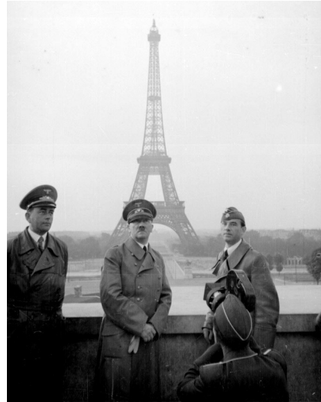
Segunda guerra mundial

Tras las guerras mundiales, los EEUU y la URSS rivalizaron en un largo e indirecto enfrentamiento ideológico, político, tecnológico (la carrera del espacio, por ejemplo) y económico (creación de dos bloques antagónicos) en multitud de guerras y conflictos (Corea, Vietnam, Cuba, Afganistán, etc.). Este período de tensión se conoce con el nombre de guerra fría .