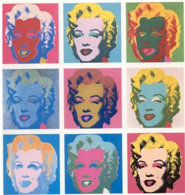
Cuadros de Marilyn Monroe (Andy Warhol)